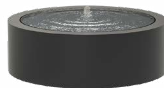
WATERTAFEL ROND ALUMINIUM