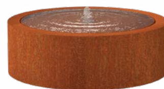
WATERTAFEL ROND CORTEN