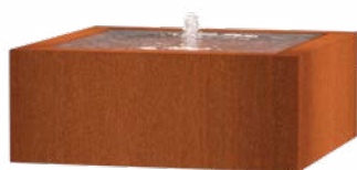
WATERTAFEL VIERKANT CORTEN