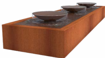
TAFEL MET SCHALEN CORTEN