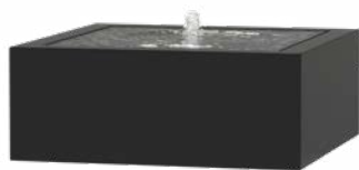
WATERTAFEL VIERKANT ALUMINIUM