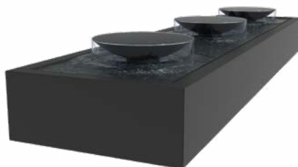
TAFEL MET SCHALEN ALUMINIUM